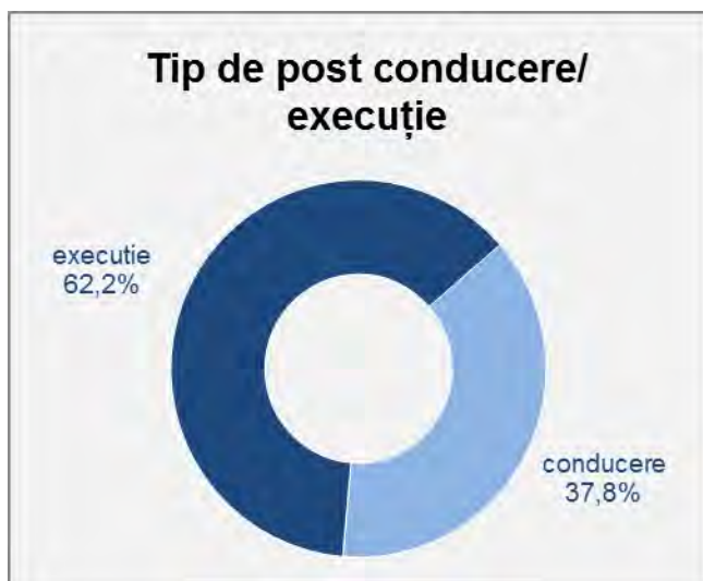
Figura nr. 3. Categoriile de post (execuție/conducere)